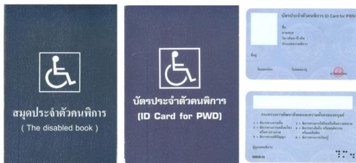
ตัวอย่างบัตรและสมุดประจำตัวคนพิการ

* กรณีได้รับเบี้ยยังชีพคนพิการอยู่แล้วและได้ย้ายเข้ามาในพื้นที่ ตำบลท่าหิน จะต้องมาขึ้นทะเบียนที่ อบต.ท่าหิน อีกครั้งหนึ่งภายใน ๑ มกราคม - ๓๐ พฤศจิกายน ของทุกปี